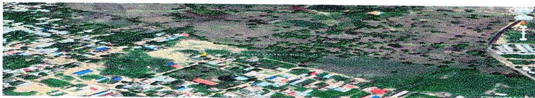
Imagen 1. Barrió San Mateo BCH – Magangué